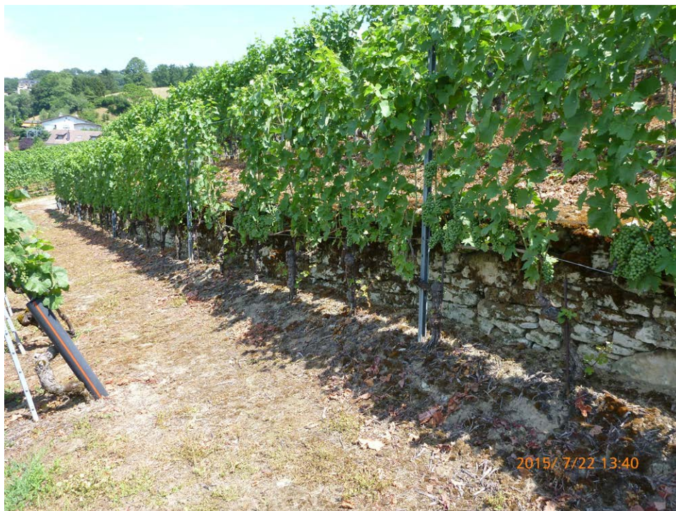
Photos de l'objet 22.07.2015